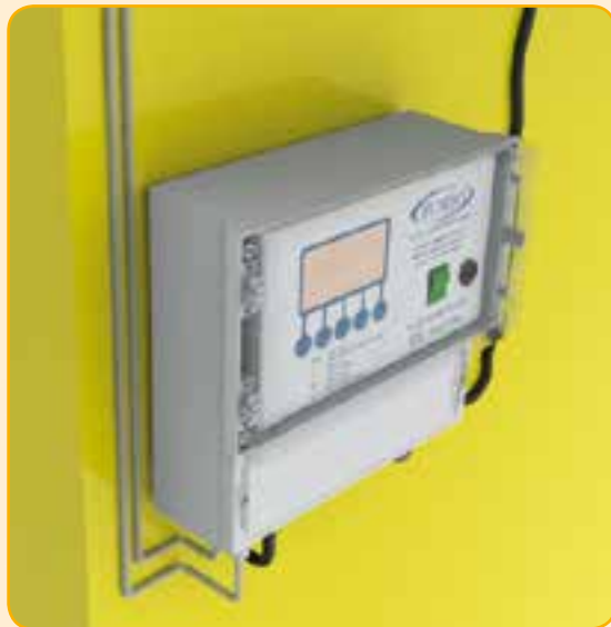
ÉCONOMISEUR MASTER ECONET

L'unité E-conet version PLUS peut être connectée au module à écran tactile appelé BEGA.