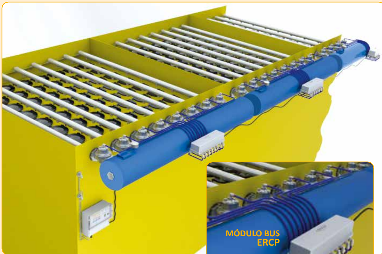
CONEXIÓN ELECTRONEUMÁTICA DE LAS VÁLVULAS